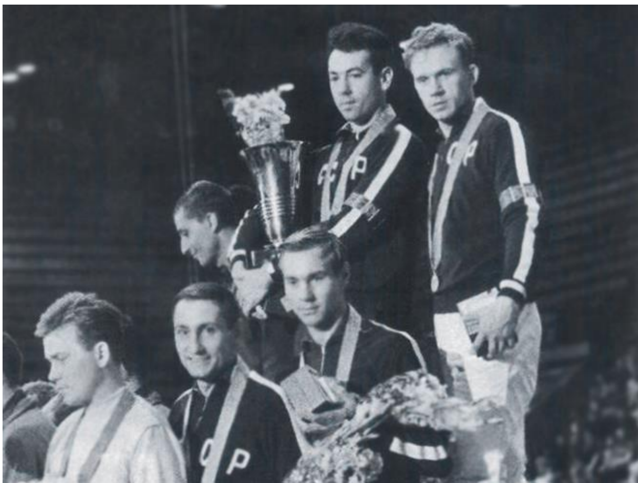
Золотая команда чемпионов

Лев Россошик, «Чемпионат», 5 декабря 2014