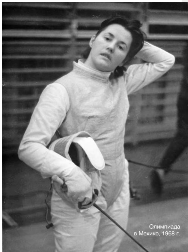
Олимпиада в Мехико, 1968 г.