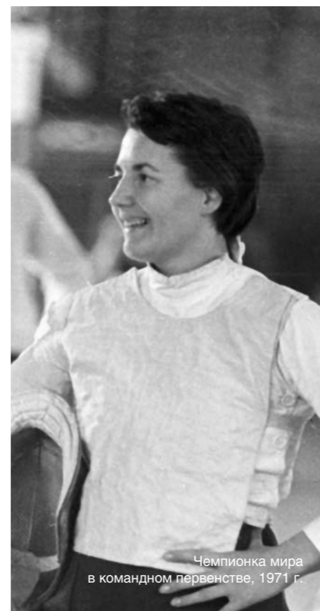
Чемпионка мира в командном первенстве, 1971 г.